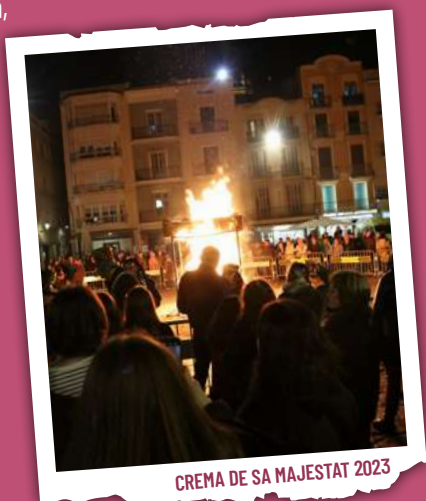
CREMA DE SA MAJESTAT 2023

A continuació , a la plaça del Mercadal, pública lectura del testament , i tot seguit, retirada de les cendres de Sa Majestat el Rei Carnestoltes LXIII. « D'oncles i ties, dol quinze dies; i, si no t'ha deixat res, un dia i no més. » Organitza: Germanat dels Set Pecats Capitals.