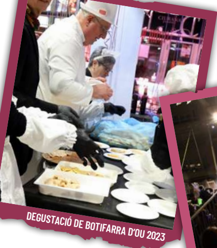
DEGUSTACIÓ DE BOTIFARRA D'OU 2023