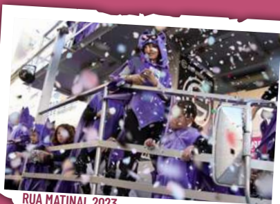
RUA MATINAL 2023

A les 11.45 h , des de la plaça de Pastoreta, RUA MATINAL ,