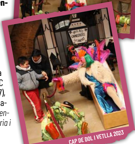
CAP DE DOL I VETLLA 2023