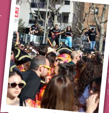
BALL VERMUT 2023

De 18.00 a 20.00 h , des de la plaça de la Llibertat, RUA DEL CONFETI , que passarà pel carrer del Doctor Robert, plaça de Catalunya, ravals del Pallol, de