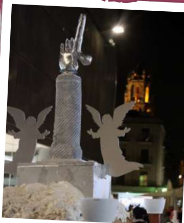
CERCAVILA DEL BRAÇ INCORRUPTE 2023

Del 6 al 17 de febrer, a la Sala d'Exposicions del Palau Bofarull, XVIII Mostra Fotogràfica del Carnaval de Reus «45 anys del Carnaval reusenc» .