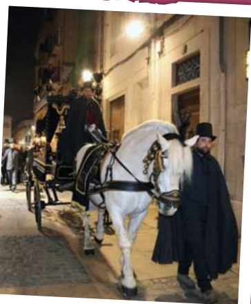
RUA MORTUÒRIA 2023

A les 19.00 h , des del Campanaret, Ball de la Quaresma i de les Set Virtuts , amb l'acompanyament musical del grup Staccato. « Abans d'ahir, ahir, avui, demà, demà passat, dissabte i diumenge. Quin dia és avui? » Organitza: Germanat dels Set Pecats Capitals.