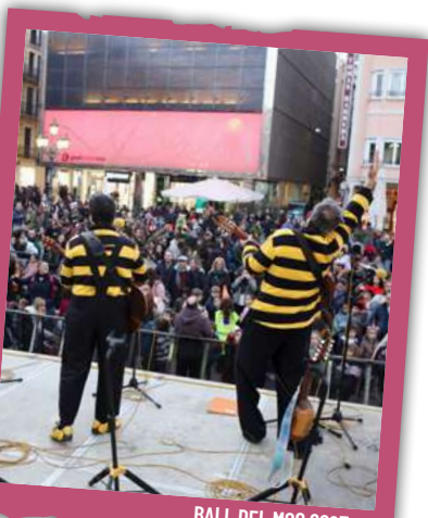
BALL DEL MOC 2023

De 19.00 a 22.00 h , a La Palma (c. Ample 75), JoveReusFest Carnaval , festa de disfresses per a joves nascuts el 2008, 2009 i 2010. Entrada: 3 € (inclou refresc i got). Condiició imprescindible: venir disfressat. Festa lliure d'alcohol i fum. Caldrà ensenyar el DNI a l'entrada. Inscripcions: joventut.reus.cat a partir del 26 de gener a les 16.00 h. Online a https://inscripcions.reus.cat/jovereusfestcarnaval o físicament a El Racó de La Palma, de dimecres a dissabte a partir de les 18.30 h. «Pa tou i vi vell fan tornar jove el vell.» Organitza: Casal de Joves La Palma i AMCA.