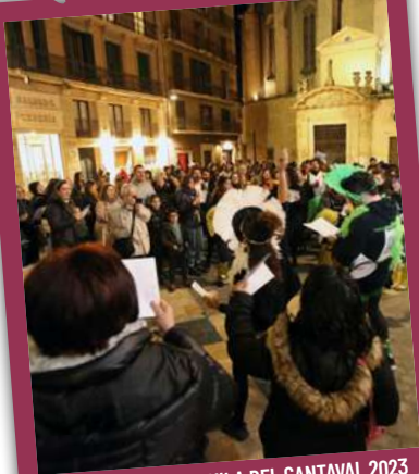
CERCAVILA DEL CANTAVAL 2023

A les 19.00 h , des de la plaça de les Peixateries Velles i pels