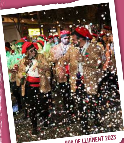
RUA DE LLUÏMENT 2023

De 18.00 a 21.00 h , al llarg de la plaça de la Pastoreta, passeigs de Prim i de Sunyer, plaça del Nen de les Oques, passeigs de Sunyer i de Prim i plaça de la Pastoreta, gran RUA DE LLUÏMENT , amb totes les colles participants i presidida pel Rei Carnestoltes i per la Reina. «A Carnestoltes, bones voltes.»