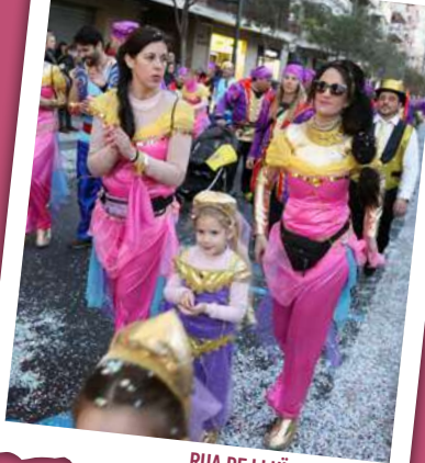
RUA DE LLUÏMENT 2023

De 17.00 a 18.00 h , a la plaça de la Pastoreta i al passeig de Prim, plantada de carrosses . «Per Carnestoltes, totes les bèsties van soltes.»