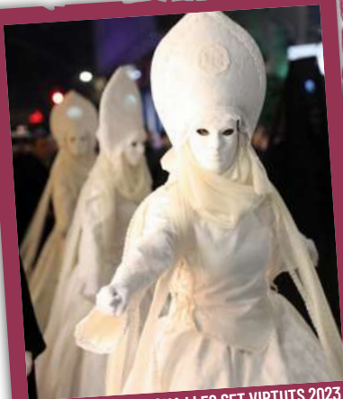
BALL DE LA QUAESMA I LES SET VIRTUTS 2023

A les 20.30 h , a la plaça de les Peixateries Velles, sota de la nova imatge de la Vella Quaresma d'enguany , interpretació íntegra del Ball de la Quaresma i les Set Virtuts . «La Quaresma són set setmanes: una coixa, cinc sanes i una santa.» Organitza: Germandat dels Set Pecats Capitals.